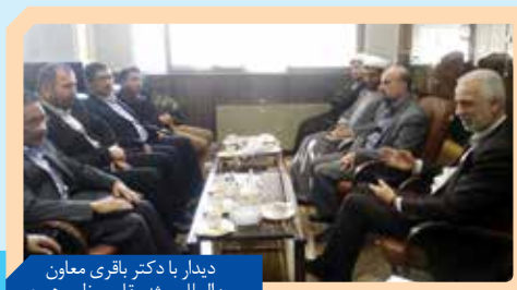
دیدار با دکتر باقری معاون بین الملل بعثه مقام معظم رهبری