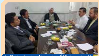
نشست ریاست دانشگاه مذاهب اسلامی با روسای دانشگاه‌های اندونزی در خصوص عملیاتی شدن توافقات پیشین