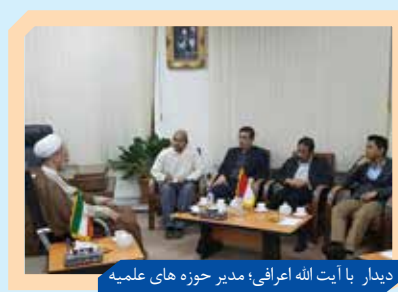
دیدار با آیت‌الله اعرافی؛ مدیر حوزه های علمیه