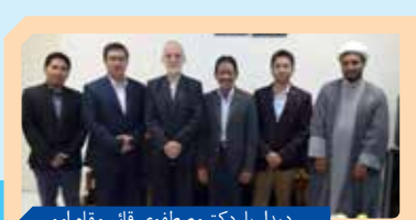
دیدار با دکتر مصطفوی قائم مقام امور بین الملل دفتر مقام معظم رهبری