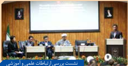
نشست بررسی ارتباطات علمی و آموزشی دانشگاه‌های ایران و اندونزی در تهران