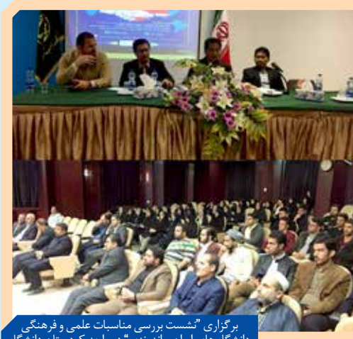
برگزاری «نشست بررسی مناسبات علمی و فرهنگی دانشگاه‌های ایران و اندونزی» در واحد کردستان دانشگاه