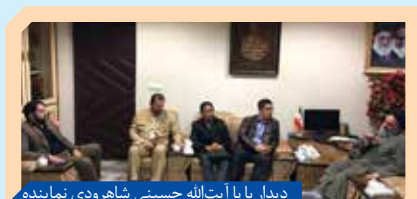
دیدار با آیت‌الله حسینی شاهرودی نماینده محترم ولی فقیه در استان کردستان