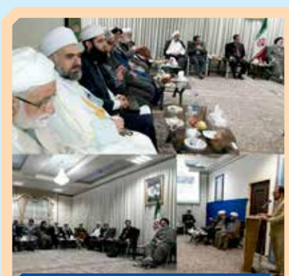
نشست علما و اعضای شورای افتاء و روسای دانشگاه‌های استان کردستان با رؤسای دو دانشگاه مهم اسلامی اندونزی و مسئولان دانشگاه مذاهب اسلامی