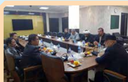
دیدار با دکتر منوچهر منکی معاون بین الملل مجمع تقرب مذاهب اسلامی