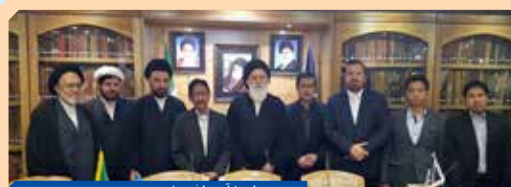
دیدار با آیت‌الله علوی بروجردی نوه مرحوم «آیت‌الله العظمی بروجردی» طلابه دار تقرب